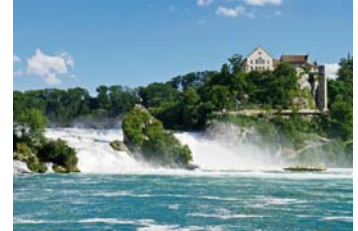
**สงวนสิทธิ์งดล่องเรือในวันที่