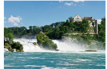
ที่ใหญ่และสวยที่สุดในยุโรป

สถาปัตยกรรมไว้ได้อย่างสมบูรณ์ จนได้รับรางวัล THE FIRST WAKKER PRIZE ในปี ค.ศ. 1972 อิสระเดินเล่นพร้อมบันทึกภาพตัวอาคารบริเวณจัตุรัสกลางเมืองที่มีการทาสีเป็นสัญลักษณ์โดดเด่นของแต่ละหลัง แล้วเดินทางสู่เมืองชาฟเฮาเซน (SCHAFFHAUSEN) นำท่านล่องเรือสู่น้ำตกเพื่อชมความงามชมน้ำตกไรน์ (RHINEFALLS)